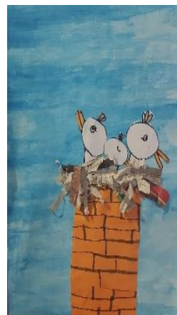
Sofija Pintarič, 2. g