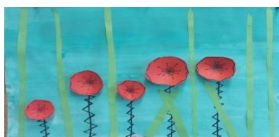
Aljaž Šmigoc, 2. g